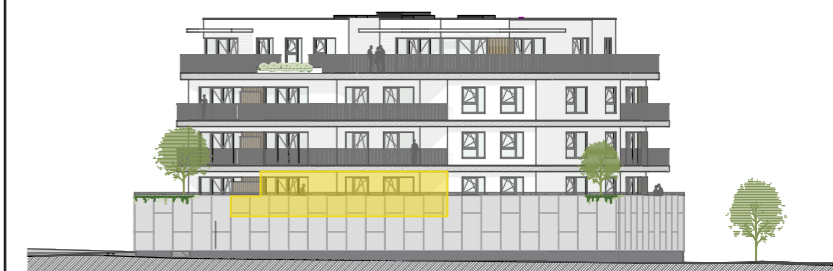
Façade Avenue Alphonse Allard