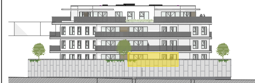
Façade Angle de l'avenue Alphonse Allard et Petite Rue à l'Art